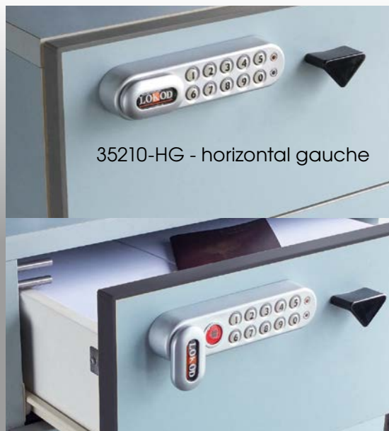
35210-HG - horizontal gauche

Modèle avec numérotation droite ou gauche